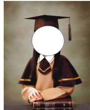
2면: 개인 학사모