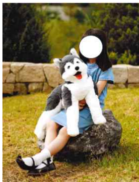
3면: 개인 프로필(사복, 야외컷)