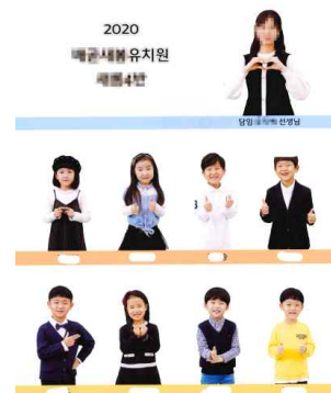
4면: 학급 프로필