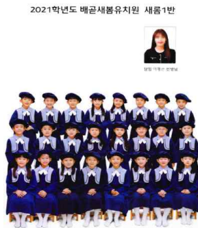
1면: 교사, 유아단체사진(합성)