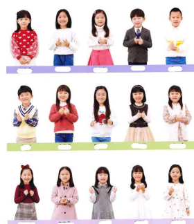
5면: 학급 프로필